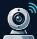
IP (rede digital, alta resolucao)