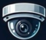
Dome (cupula, interna)