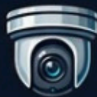
PTZ (gira e zoom, areas amplas)