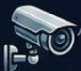
Bullet (cilindrica, externa)